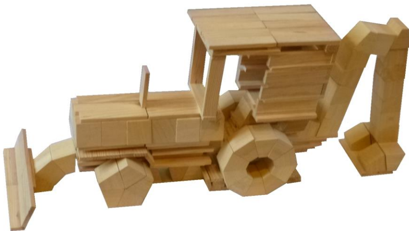
Tractopelle : 2 joints collés (roues avant)