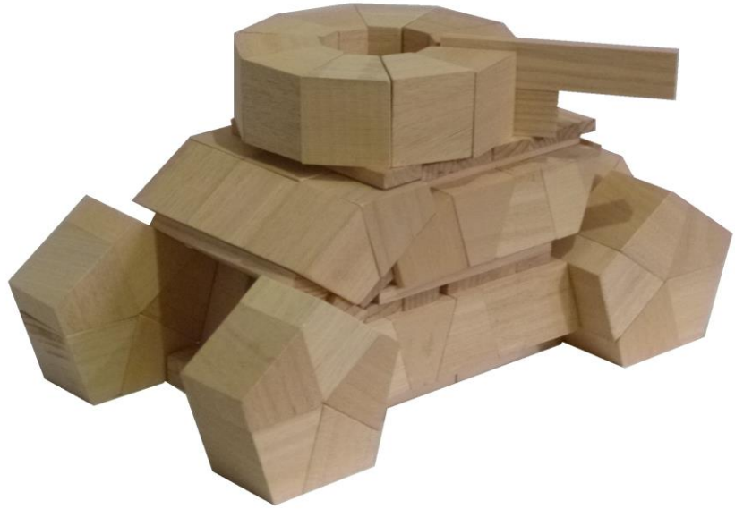
Char : sans colle